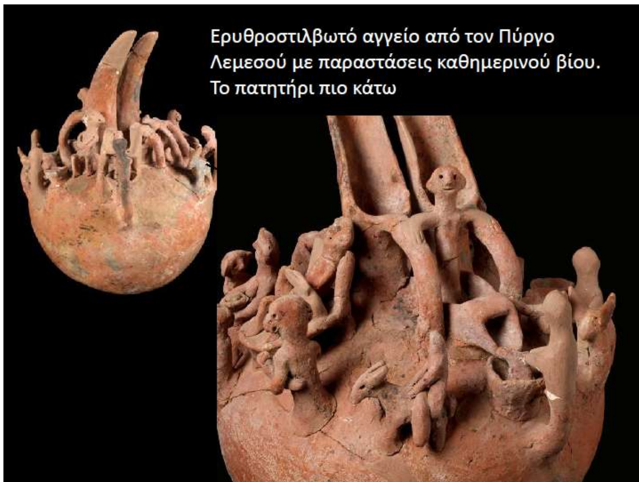
Ερυθροστιλβωτό αγγείο από τον Πύργο Λεμεσού με παραστάσεις καθημερινού βίου. Το πατητήρι πιο κάτω

Μια εγκατάσταση στην Άλασσα, που χρονολογείται στην Ύστερη εποχή του Χαλκού, έχει ταυτιστεί με πρώτο στην Κύπρο πιεστήριο σταφυλιών, ενώ ένα αγγείο από την Δρομολαξιά πιθανό να χρησιμοποιήθηκε ως ληνός. Στη συνέχεια η παραγωγή κρασιού επιβεβαιώνεται από σειρά πατητηριών είτε αυτά είναι λαξευμένα στον φυσικό βράχο είτε είναι κτιστά. Τέτοιες εγκαταστάσεις είναι γνωστές στην Παρεκκλησιά, την Γεροσκήπου, την Έμπα, την Ερήμη, αλλά και στην κατεχόμενη σήμερα Αγία Ειρήνη, Κερύνειας (Εικ. 3). Οι λαξευτές εγκαταστάσεις παρουσιάζουν πολλά προβλήματα στη χρονολόγησή τους, όμως ορισμένες ανάγονται με κάποια βεβαιότητα στην Ελληνιστική και τη Ρωμαϊκή περίοδο.