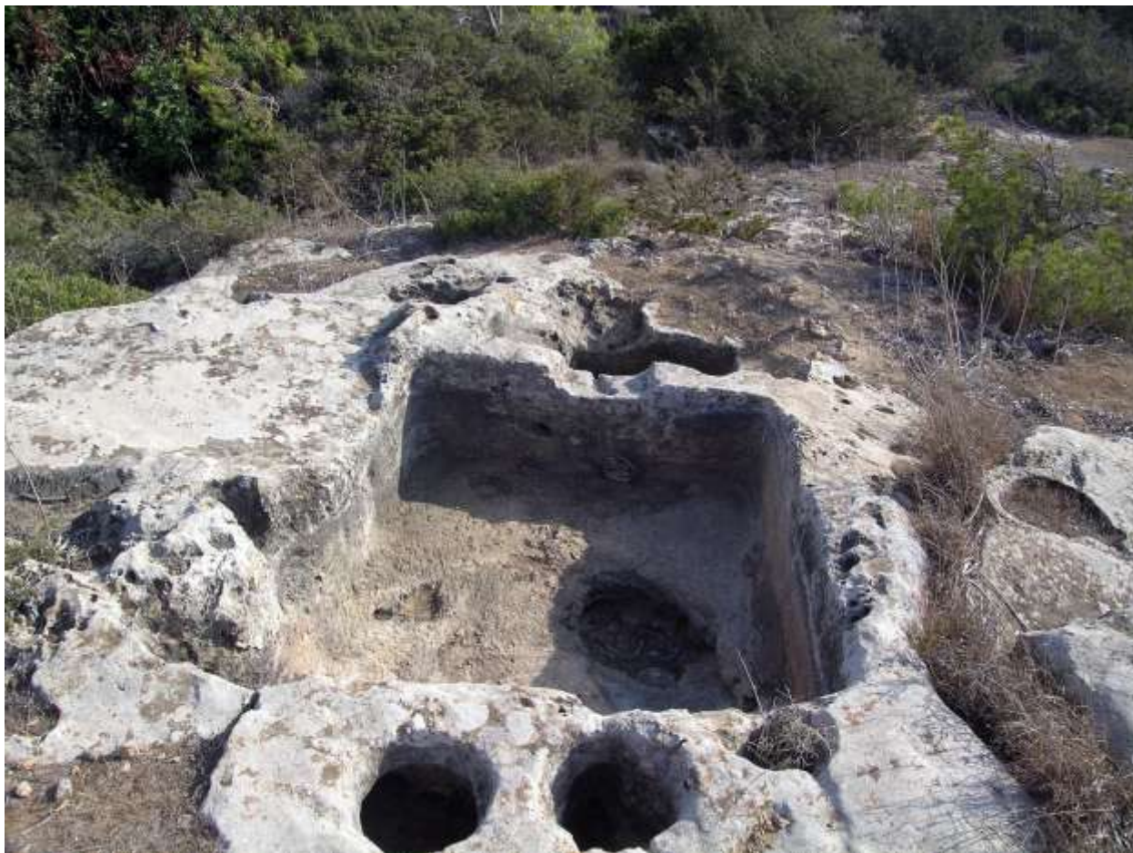
Εικ. 3 Λαξευτό πατητήρι (ληνός) από την Αγία Ειρήνη Κερύνειας

Πρόσφατα έχει αναληφθεί χημική ανάλυση αριθμού αγγείων, που λόγω σχήματος υπονοούσαν τη χρήση τους ως δοχείων κρασιού. Αναλύσεις σε 12 οξυπύθμενα αγγεία από την Ερήμη, που χρονολογούνται γύρω στο 3500 π.Χ. αποδείχτηκε ότι διατηρούσαν στον πυθμένα τους τρυγικό οξύ, που υποδηλώνει την ύπαρξη προϊόντος από σταφύλι, κατά πάσα πιθανότητα κρασί. Αναλύσεις έγιναν επίσης σε σταφυλόσχημο αγγείο από τη Σουσκίου της ίδιας περιόδου καθώς και σε ρυτό σε σχήμα κέρατος από το νεκροταφείο των Βουνών με θετικά αποτελέσματα.